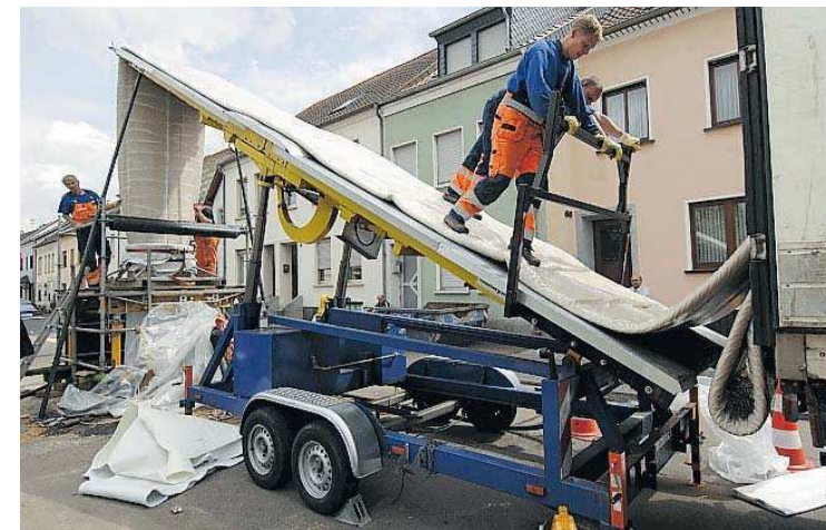
Arbeiter lassen den Schlauch ins Kanalrohr. Getränkt mit flüssigem Kunststoff härtet er bei Hitze zum Rohr aus.

Durch das Schlauch-Inliner-Verfahren verkürzt sich die Bauzeit auf wenige Wochen. Im April war mit den Arbeiten begonnen wurde, im Juli sollen sie bereits abgeschlossen sein. Die Straße muss zudem nur an einigen wenigen Kanalzugangsstellen geöffnet werden. Die Kosten für das rund 420 Meter lange Kanalsanierungsstück werden auf rund 600 000 Euro beziffert.